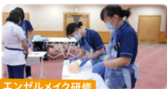
エンゼルメイク研修