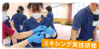
ミキシング実技研修