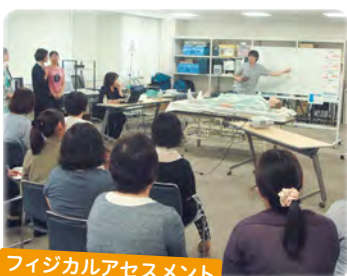
フィジカルアセスメント

当院には「DMAT(災害派遣医療チーム)隊」があります。災害拠点病院として重要な存在です。定期的な勉強会や訓練を欠かさず、知識や技術の向上に努めています。災害看護に興味をお持ちの方、一緒に活動してみませんか?