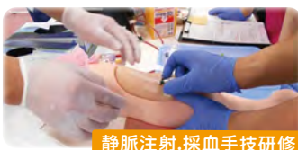
静脈注射・採血手技研修