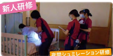
夜間シュミレーション研修