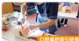
口腔鼻腔吸引研修